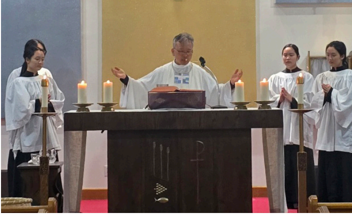
주님만찬 성목요일_ 미사와 발씻김 예식